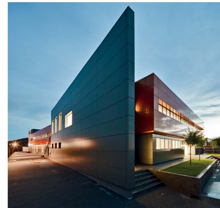
Datacenter mateřské firmy v Arezzu, Itálie

V roce 2016 společnost zorganizovala pro zákazníky první workshop, kde si mohli prakticky vyzkoušet cloudové služby. Pro rok 2017 je naplánováno zavedení programu pro start-upy.