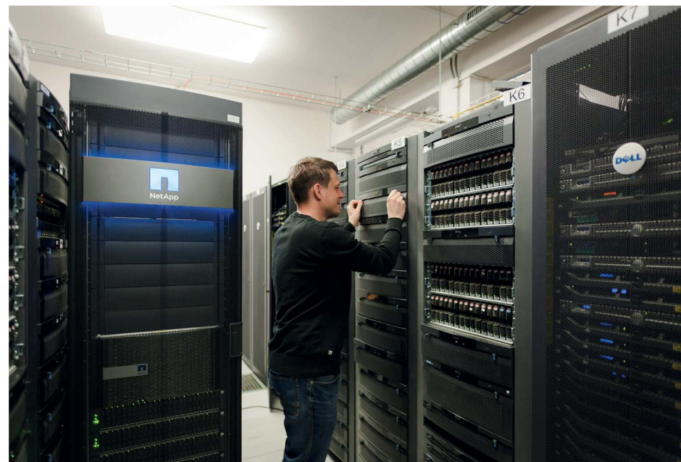
Pohled do jedné ze serveroven DC FORPSI, Ktiš

V roce 2002 zde byla založena akciová společnost INTERNET CZ. K webhostingu postupně přibýly služby, jako je registrace doménových jmen, serverhosting a poskytování připojení k internetu. Toto rozšíření portfolia služeb bylo v roce 2004 příčinou více než dvojnásobného navýšení počtu zaměstnanců. Bylo proto nutné najít nový, větší prostor. Před koncem roku 2004 tak byl zakoupen objekt bývalého ubytovacího a stravovacího střediska ve Ktiši, jehož rekonstrukce a přeměna v moderní datacenter proběhla hned v roce následujícím. Rok 2005 byl v historii firmy zlomový. Společnosti sdružené pod značkou FORPSI se staly majetkem italské hostingové společnosti ARUBA S.p.A. a začala se tak psát i novodobá historie firmy. Příliv zahraničního kapitálu a související investice umožnily modernizování technologií a zařazení značky FORPSI na špičku v oboru, a to nejen na českém trhu. V roce 2006 FORPSI úspěšně expandovalo na polský a maďarský trh. Technologicky jsou ale tyto trhy od počátku obsluhovány z datacentra v jihočeské Ktiši. V roce 2007 byla provedena fúze společností P.E.S. Consulting, s.r.o. a INTERNET CZ, a.s. Nástupnickou organizací se stala společnost INTERNET CZ, a.s., která nadále své