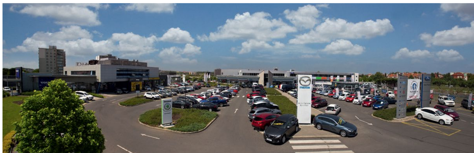
Moderní prodejní a servisní areál Auto Palace Spořilov v Praze